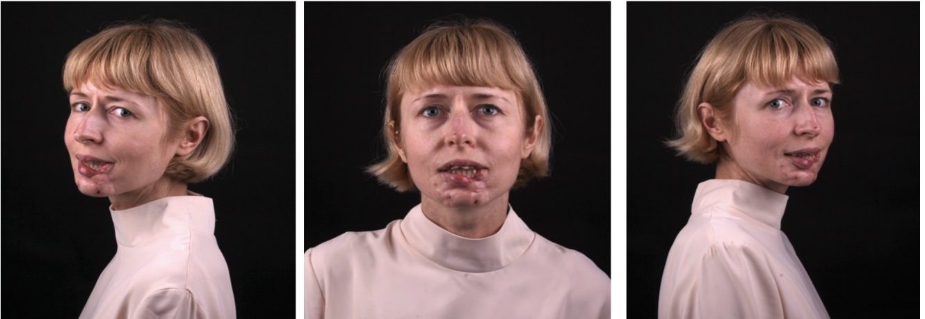
Рис. 1. Антропотомерия в день обращения

Дефекты челюстно-лицевой области (ЧЛО) значительно влияют на здоровье и качество жизни пациентов. Основными причинами образования дефектов этой области являются травмы разной этиологии, резекция тканей после проведения операций по удалению образований разного генеза, минно-взрывные ранения, врожденные аномалии и ятрогенные повреждения.