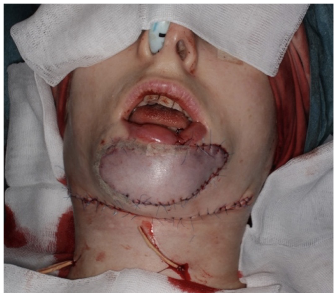
Рис. 3. Вид раны после фиксации лоскута в области дефекта и ушивания донорского ложа