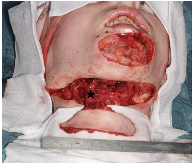
Рис. 2. Вид сформированного дефекта и выделенного субментального лоскута на сосудистой ножке (показано звездочкой)

Для устранения остаточных деформаций после закрытия дефектов необходимо дополнительно проводить корректирующие операции местными тканями, чтобы улучшить внешний вид пациента.