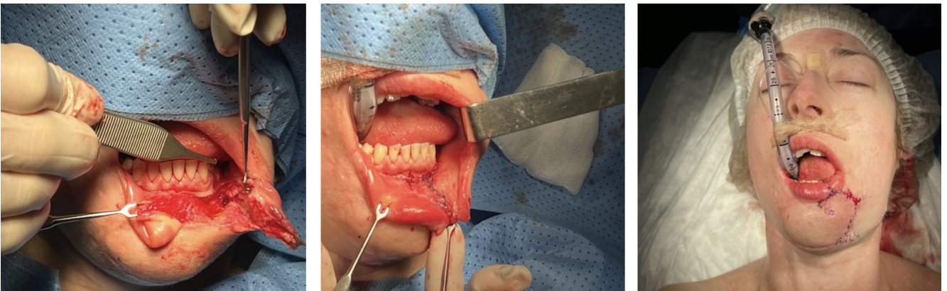
Рис. 7. Второй хирургический этап: пластическая коррекция нижней губы и мягких тканей подбородочной области через семь месяцев после основного этапа