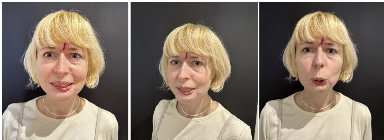
Рис. 8. Антропометрия через 11 месяцев после операции